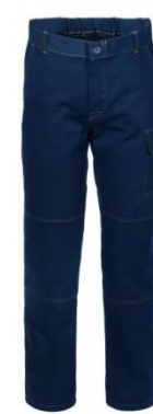
01 - BLU