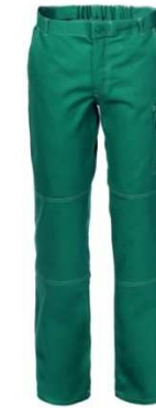
04 - VERDE