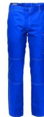
06 - AZZURRO ROYAL