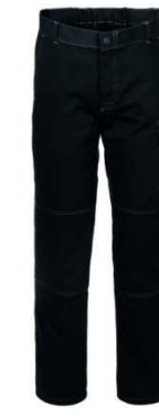
05 - NERO