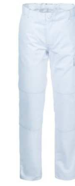
02 - BIANCO